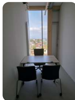
Bulle de RDV