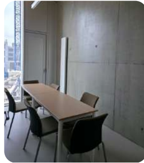
Bulle de travail